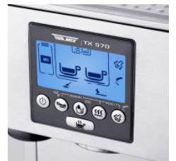
LCD-Display mit vielen Einstellungsmöglichkeiten